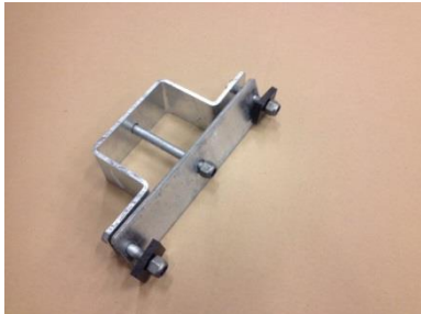
Fäste för bom 120x80