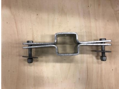
Fäste för bom 80x80

Beroende på bomprofil får man olika flytkroppsfästen och olika låsbultar. Att montera flytkroppsfästen är likadant för alla bomprofiler.